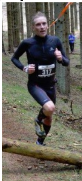
Salomon Lakeside Trail

Træningen er genoptaget, men jeg passer på med den intensive træning, og det lader til at det hjælper og der er klar fremgang at spore.